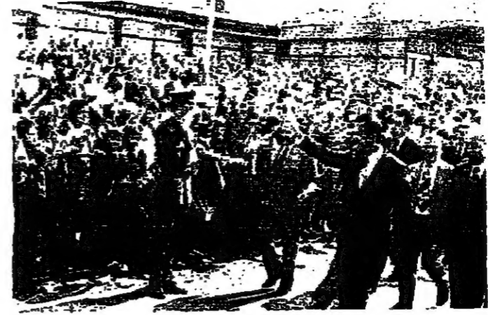
الرئيس الأسد يصلي الجماهير في ببراغ

كتبته عيادة باقي استمرت زيارة الرئيس السوري حافظ الأسد الى تشيكوسلوفاكيا بأهمية بالغة، إذ أنها تأتي ضمن التصرك السياسي السوري من جهة كسب مزيد من الأصدقاء والمؤيدين، وضمن التصرك الاقتصادي والعسكري من جهة أخرى لدعم الاقتصاد السوري والجيوش العسكرية الموجهة لإسرائيل.